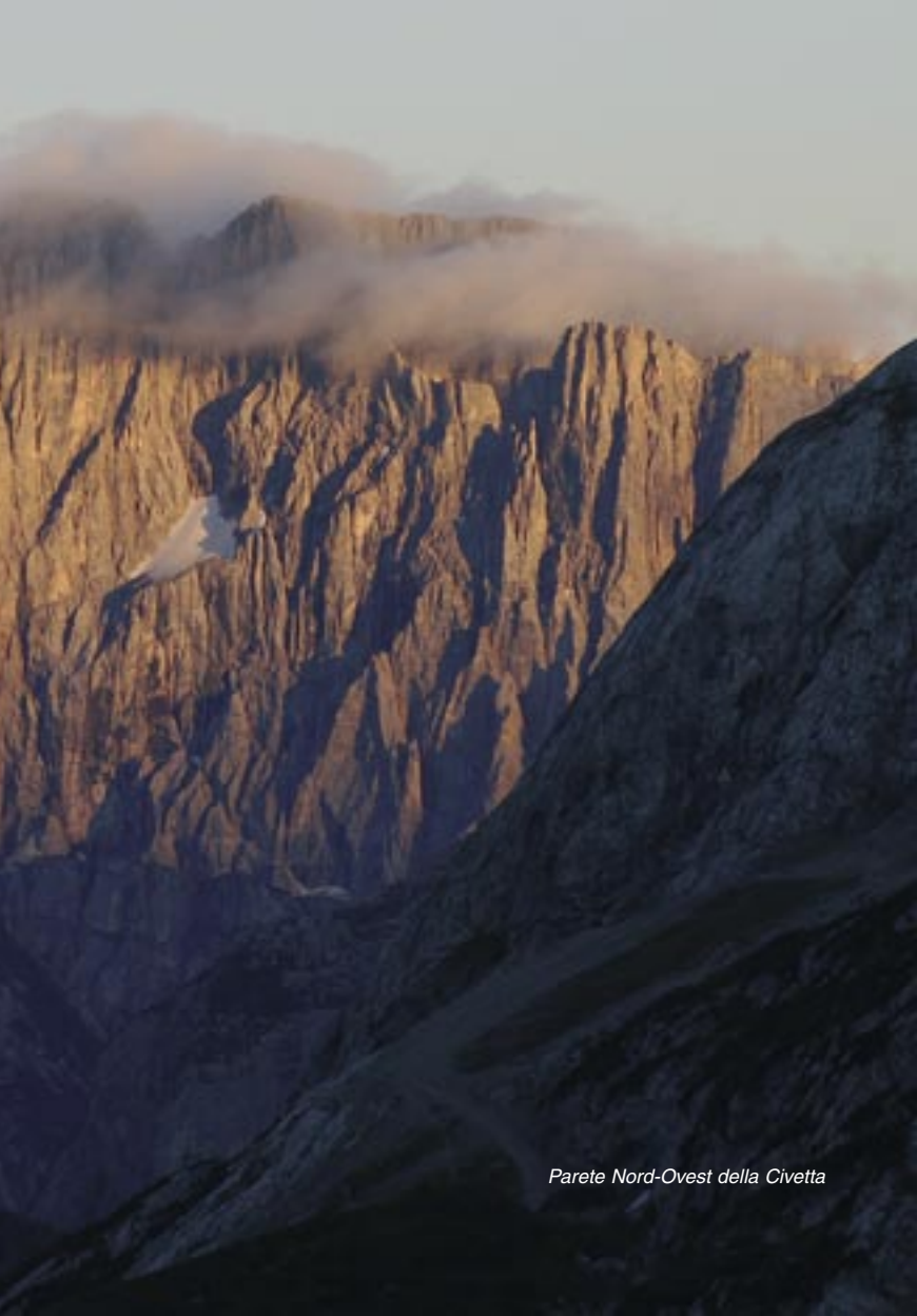
Parete Nord-Ovest della Civetta