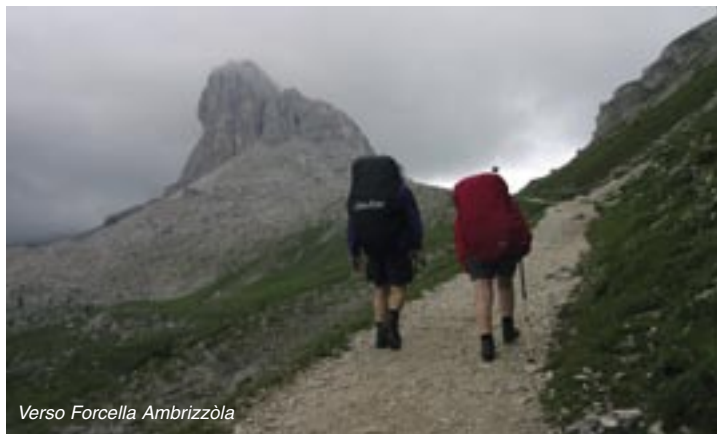
Verso Forcella Ambrizzòla

basso, anche con alcune corde fisse. Infine il sentiero porta a sinistra, al culmine di un ripido costone erboso parallelo al canalone, per il quale si scende con stretti zigzag. In basso si tocca di nuovo il canalone che subito si lascia per passare su di un comodo sentiero che porta fra i massi e poi sul pascolo, fin sul dosso che scende tranquillo e riposante al Passo Giàù, 2236 m, dove c'è un ottimo albergo e ristorante.