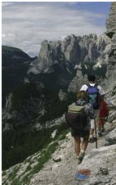
Dal Rifugio Vazzolèr al Rifugio Carestiatto

Si continua a scendere per la strada bianca (che divalla per la Val Corpassa fino alla Capanna Trieste e a Listolàde, sulla Statale 203, nell'Agordino). Alla seconda grande ansa a quota 1430 m, in località Sass da la Dispensa con piccolo spiazzo verde di pascolo, si stacca a sinistra (sud) il sentiero n. 554 che si deve seguire.