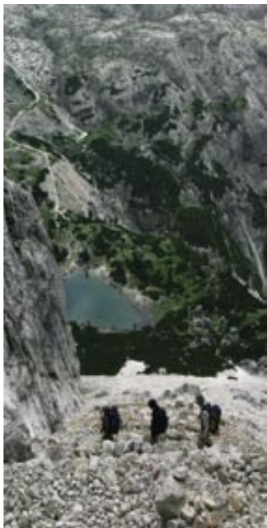
Scendendo verso il laghetto del Lagazuòi

Dalla forcella si scende a sud per ghiaie ripide, fra massi, fino a giungere nella stupenda oasi dell'Alpe o Monte de Lagazuòi dove risplende l'occhio magico del piccolo Lago Lagazuòi, 2182 m, nel quale si rispecchiano le ardite architetture della Torre del Lago e della Cima Scotóni con la immensa porta di roccia della Cima Fànìs Sud.