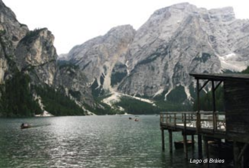
Lago di Bràies

Il Rifugio Biella, massiccia costruzione in muratura a tre piani, isolata in una radura di aspetto lunare, è di proprietà della Sezione di Treviso del CAI. Costruito nel 1906 e rifatto nel 1926, fa servizio d'alberghetto (attualmente con cuoco nepalese) ed è aperto dal 20 giugno al 20 settembre; offre 46 posti, più 6 nel locale invernale; illuminazione con gruppo; acqua e servizi igienici all'interno; Stazione di Soccorso del CNSAS "118"; telefono rifugio +39 0436 866991.