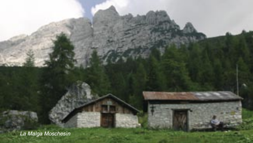
La Malga Moschesin

Dal Rifugio Carestiato si prosegue sulla stradina, prima ripida a nord poi comoda a sud ed est, che porta il n. 549. Traversati i bei pascoli con leggeri saliscendi, si lascia la strada e si prende a sud est il sentiero che va giù deciso verso il Passo Duràn, 1601 m, che si raggiunge in circa 45 minuti dal Rifugio Carestiato.