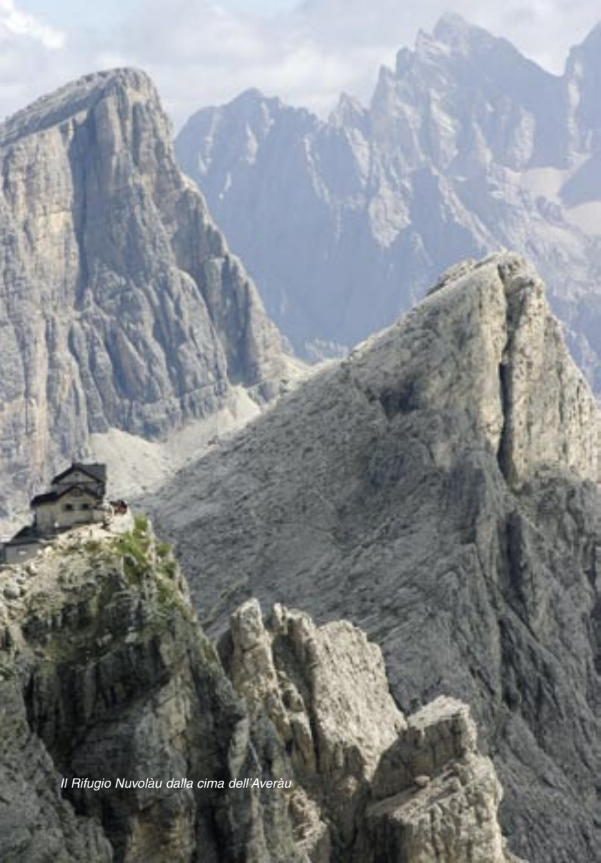
Il Rifugio Nuvolàu dalla cima dell'Averàu