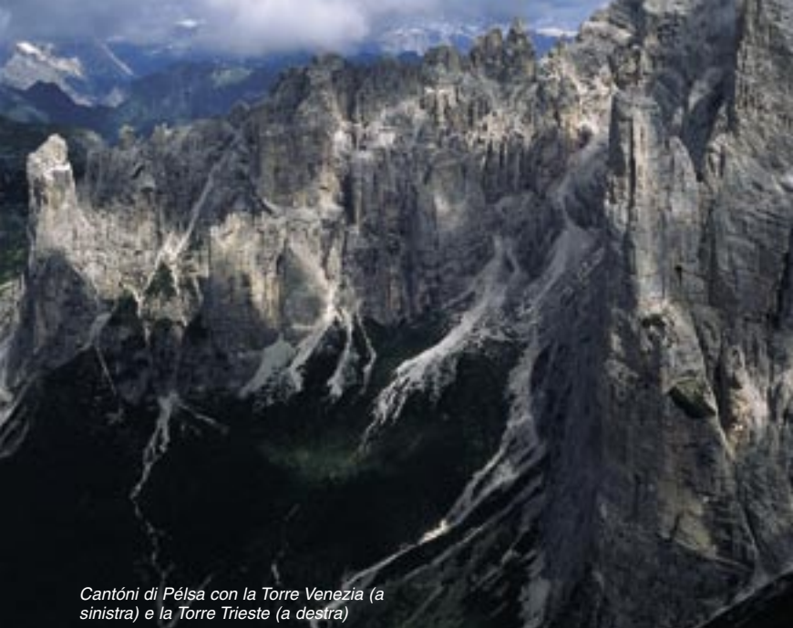
Cantóni di Pélisa con la Torre Venezia (a sinistra) e la Torre Trieste (a destra)

Dal Rifugio Tissi conviene ritornare alla Forcella del Col Reàn a riprendere il sentiero n. 560 che scende prima verso sud ovest, poi a sud verso il pittoresco Pian de la Lòra, passando per ciò che resta del Casón di Col Reàn, 1895 m, dominato dalle bastionate gigantesche della Cima De Gasperi, Su Alto e Terranova. Salendo dolcemente si perviene alla Sella di Pelsa, 1914 m, con incantevole vista sui Cantoni di Pelsa, aghi giganteschi di dolomia contorta.