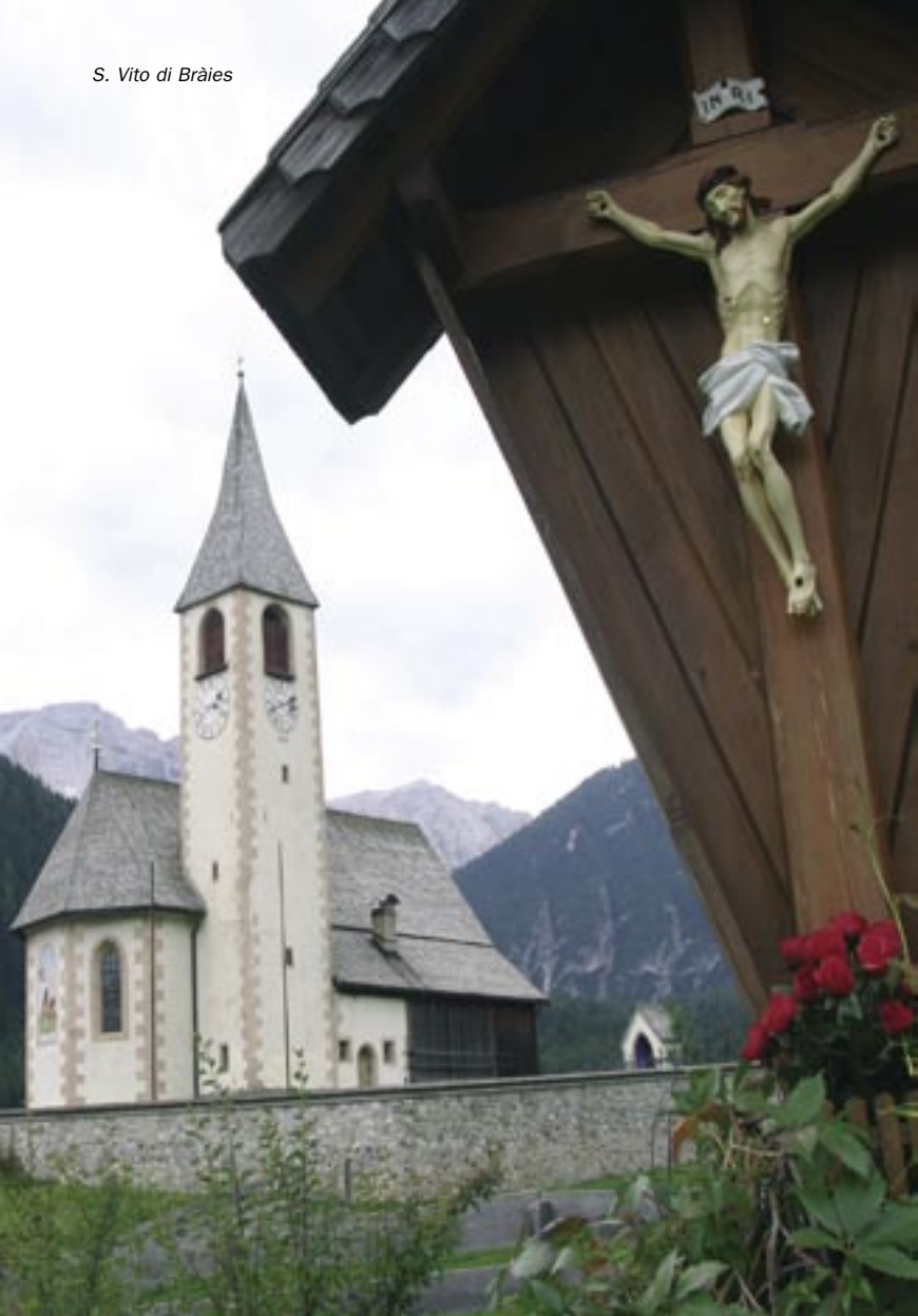
S. Vito di Bràies