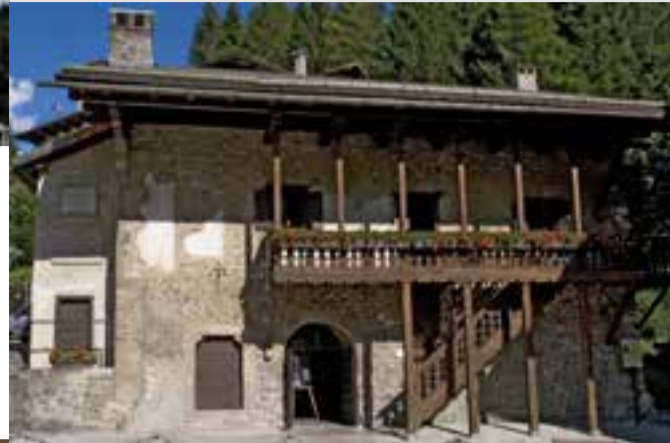
Pieve di Cadore, Casa di Tiziano

Wir erreichen damit Comelico Superiore mit den berühmten Scheunen beginnt und Padola ladinischen Museum der Alpine Kultur des Comelico. Unsere Route endet in Sappada , dem vom Italienischen Touringclub die Orange Fahne verliehen wurde: der Ort ist eine deutsche Sprachinsel, und die Einwohner legen besonders großen Wert auf die Erhaltung ihrer Landschaft und ihres antiken Brauchtums (wie z.B. der traditionellen Fastnacht). Sappada ist ein idealer Urlaubsort für Groß und Klein und wird auch den Erwartungen der anspruchsvollsten Gäste gerecht. Das kleine Bächlein, das vom Hochweißstein (Monte Peralba) herunter fließt, wird weiter talwärts zur Piave, durchfließt das gesamte Provinzgebiet Belluno und mündet schließlich bei Venedig in die Adria.