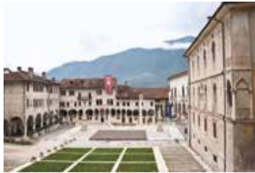
Feltre, piazza Maggiore