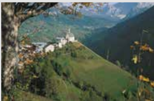
Colle Santa Lucia

Auf dem Heimweg empfehlen wir einen Spaziergang durch die spektakuläre Schlucht Serrai di Sottoguda , eine wunderschöne Naturreserve. Ebenfalls sehenswert sind: die Ortschaft Pieve di Livinalongo mit dem Ladinischen Museum; die Ortschaft Arabba am Fuße des mächtigen Sellamassiv; weiter in Richtung Cortina d'Ampezzo, gelangt man zum Schloss Buchenstein (Rocca di Andraz) , einer Burg aus dem XI. Jahrhundert. Fährt man nachher über den panoramareichen Falzarego Sattel weiter, gelangt man in das sonnige Becken von Ampezzo.