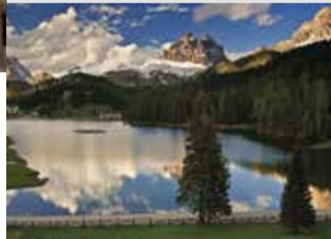
Misurina See