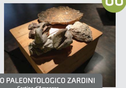
MUSEO PALEONTOLOGICO ZARDINI Cortina d'Ampezzo