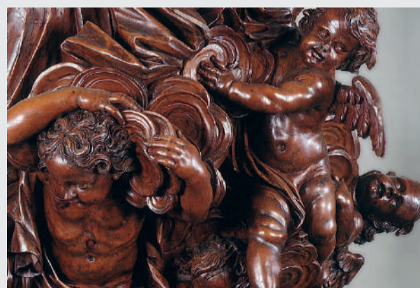
ARTE SACRA DI FELTRE