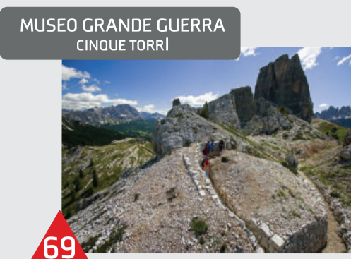
MUSEO GRANDE GUERRA CINQUE TORRI

Un'altra tappa è il museo geologico minerario di Agordo, erede dell'antichissima attività di estrazione delle miniere di Val Imperina, che conserva i più antichi fossili delle Dolomiti. Sempre ad Agordo, nel cortile dell'Istituto minerario è visitabile il sentiero "Cento passi nella geologia delle Dolomiti" che illustra la successione stratigrafica delle Dolomiti con campioni di rocce che si possono toccare con mano. Al Museo Civico di Selva di Cadore si possono ammirare i calchi delle impronte dei dinosauri triassici.