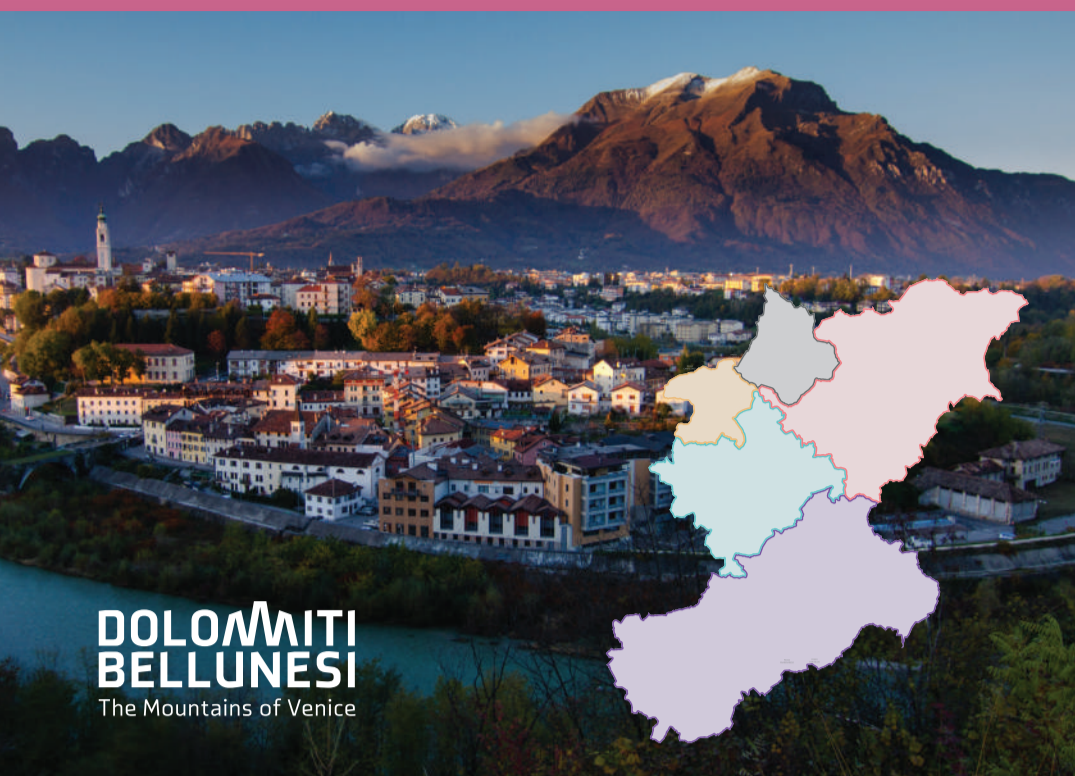
DOLOMITI BELLUNESI The Mountains of Venice