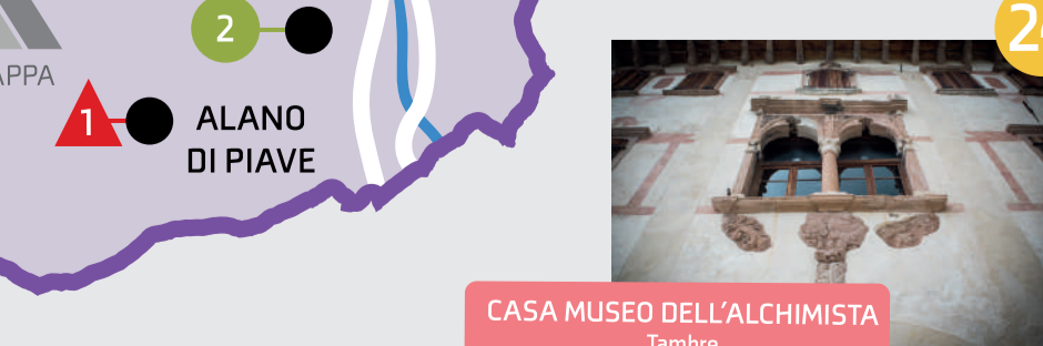
CASA MUSEO DELL'ALCHIMISTA Tambrè