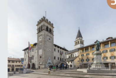
PALAZZO DELLA MAGNIFICA COMUNITÀ DI CADORE