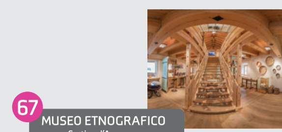
MUSEO ETNOGRAFICO Cortina d'Ampezzo