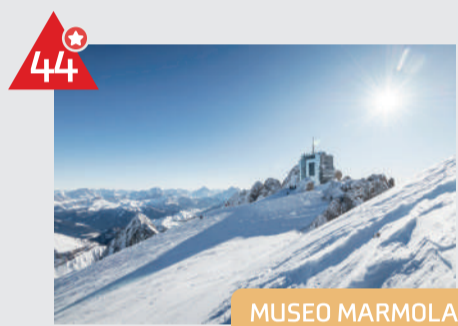
MUSEO MARMOLADA GRANDE GUERRA

Ma sono da ricordare anche due altre chicche d'altura: il museo del Castello di Andraz, sentinella della via del ferro nell'alta Val Cordevole e la casa-museo "Angiul Sai" nell'antico borgo di Costalza a S. Pietro di Cadore.