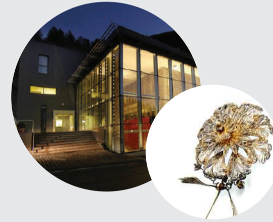
MUSEO ETNOGRAFICO DOLOMITI Belluno

Gli appassionati di arti e mestieri tradizionali non possono perdersi i seggiolai a Gosaldo e Rivamonte, gli scalpellini di Castellavazzo, gli zattieri a Codsagò, i "Cordarati" e i gelatieri della Val di Zoldo, i "maestri dell'occhiale" di Pieve di Cadore e di Agordo, gli artigiani del ferro e del vetro della Galleria Rizzarda a Feltre e i "Maestri Spada" rinascimentali di Palazzo Fulcis a Belluno.