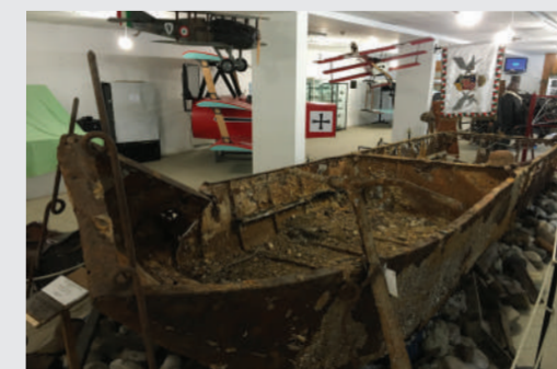
MUSEO PALEONTOLOGICO ZARDINI Cortina d'Ampezzo