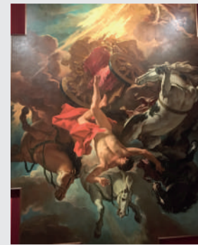
MUSEO D'ARTE DELLA PROVINCIA DI BELLUNO

Grazie ad artisti di fama internazionale come Tiziano Vecellio, nato a Pieve di Cadore dove si conserva ancora la sua casa natale, Ippolito Caffi, Sebastiano e Marco Ricci, fino ad arrivare all'arte contemporanea, i musei d'arte della provincia di Belluno si rivelano un autentico viaggio nella storia dell'arte. Tra un tocco di pannello e una sfumatura di colore ancor oggi vivida, essi trasportano il visitatore nei secoli, nelle leggende e nei miti, facendogli vivere un'esperienza indimenticabile. Sicuramente le collezioni d'arte dei musei di Belluno e Feltre sono imperdibili da questo punto di vista.