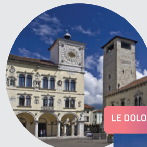
LE DOLOMITI E LA LAGUNA

Il legame tra Venezia e le Dolomiti è forte: non solo geografico, ma anche storico ed emozionale. Nelle giornate più limpide dalla Laguna veneziana si intravedono all'orizzonte le cime rocciose che, spuntando alle spalle della Serenissima, regalano un panorama mozzafiato, uno skyline unico al mondo. Un legame forte e vincente, se pensiamo che entrambi questi luoghi sono Patrimonio dell'Umanità, dall'eccezionale valore universale. Bellezze uniche al mondo, che dimostrano un perfetto equilibrio tra uomo e ambiente. Pisci così uniti e diversi che per noi rappresentano un'eredità da tramandare alle generazioni future.