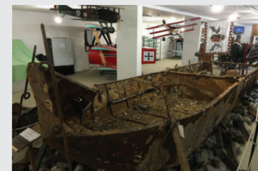
MUSEO GRANDE GUERRA