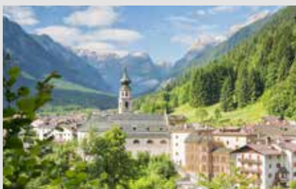
Canale d'Agordo

Siguiendo se llega al panorámico Passo Falzarego para, finalmente, llegar a la luminosa cuenca de Ampezzo.