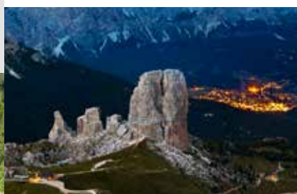
5 Torri (Cortina d'Ampezzo)