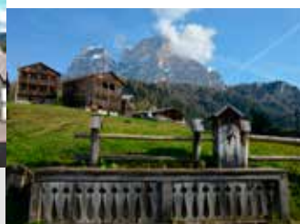
Val di Zoldo: el pueblo de Coi con Pelmo