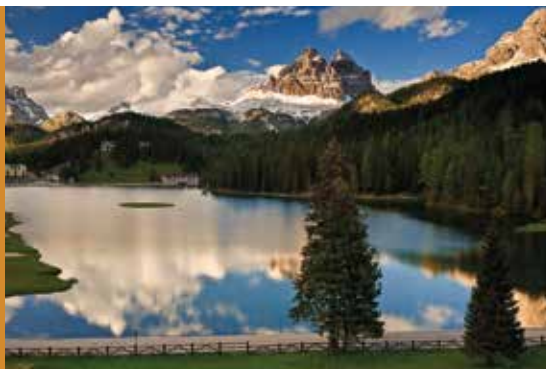
Tre Cime di Lavaredo en el lago de Misurina