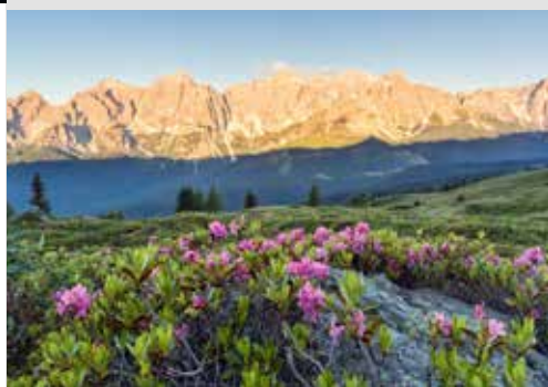
Dolomitas (Grupo Popèra)