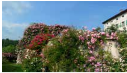
Musée ethnographique Seravella, Cesiomaggiore

Peu avant d'arriver à Belluno, prendre à droite pour une excursion en montagne sur l' Alpe del Nevegal , ou alors, en continuant au-delà de la sortie de l'autoroute A27, rejoindre le lac de Santa Croce, la forêt du Consiglio ou bien les splendides montagnes de l' Alpago pour d'agréables promenades.