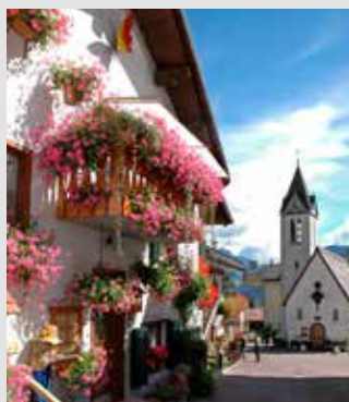
Sottoguda, un des plus beaux Villages d'Italie