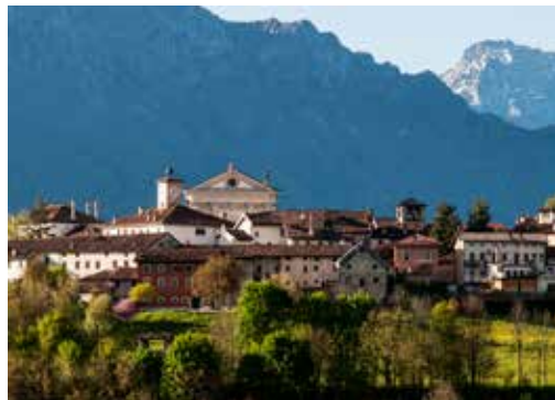
Mel, un des plus beaux Villages d'Italie