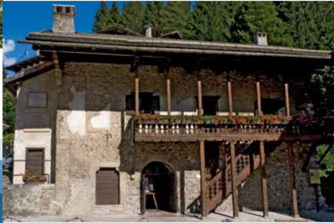
Pieve di Cadore, maison natale du peintre Titien

Notre excursion se termine dans la Val Visdende (littéralement « la vallée à voir »): un plateau de prairies vertes et de bois où l'église de Notre Dame des Neiges à Pra Marino est devenue célèbre après que le Pape Jean-Paul II y célébra une messe inoubliable pour les habitants du Cadore. La vallée est dominée par le mont Peralba d'où prend sa source le fleuve Piave et qui est accessible également de Cima Sappada: ce fleuve traverse tout le territoire de Belluno jusqu'à Venise .