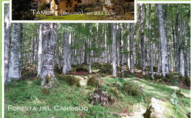
FORESTA DEL CANSIGLIO