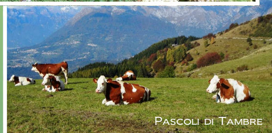
PASCOLI DI TAMBRE