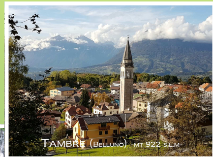
TAMBRE (BELLUNO) -MT 922 S.L.M.